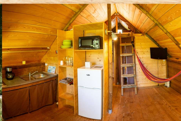
Trappeur 2 ch + SDB