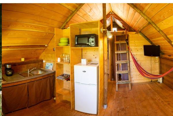
Trappeur 2 ch + SDB